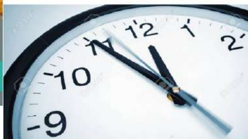
4. sz. ábra

A Ptk. 7:20.§-a alapján akadályja annak, hogy az örökhagyó a végrendeleti juttatást kifejezetten valamely feltétel beálltától tegye függővé. Ilyen végrendelet esetén a feltételnek az öröklés megnyílásáig teljesülnie kell, mivel ebben az időpontban tisztázódnia kell az örökös vagy örökösök személyének.